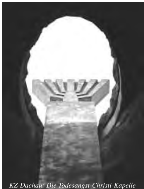
KZ-Dachau: Die Todesangst-Christi-Kapelle

bayerische Landschaft. Nebel und Nieselregen begleiteten uns bei unserem Besuch der KZ- Gedenkstätte Dachau. Dort widmeten wir uns den religiösen Erinnerungs-orten. Zwischen 1960 und 1967 entstanden an einem „Ort der Meditation“ die katholische „Todesangst-Christi-Kapelle“, die jüdische Gedenkstätte, die evangelische Versöhnungskirche und die russisch orthodoxe Auferstehungskapelle, ergänzt durch das Karmelitinnenkloster „Heilig Blut“. Die durch Lage, Form und Ausstattung mit reicher Symbolik sprechenden religiösen Bauwerke stehen für den gemeinsamen Leidens- und Todesweg der Häftlinge. Bei der heutigen kirchlichen Arbeit geht es dort immer um die Erinnerung an die Opfer und ihre Würde, um die Anregung zu Wachsamkeit gegenüber Missständen und das Eintreten für die Menschenrechte, nicht zuletzt, begründet schon im Lagerleben, um Ökumene.