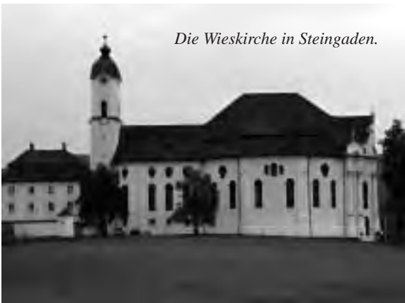
Die Wieskirche in Steingaden.

Unser Weg zum Geistigen, dargestellt in Barock und Rokoko, führte uns durch eine sonnen-durchflutete herbstlich gefärbte