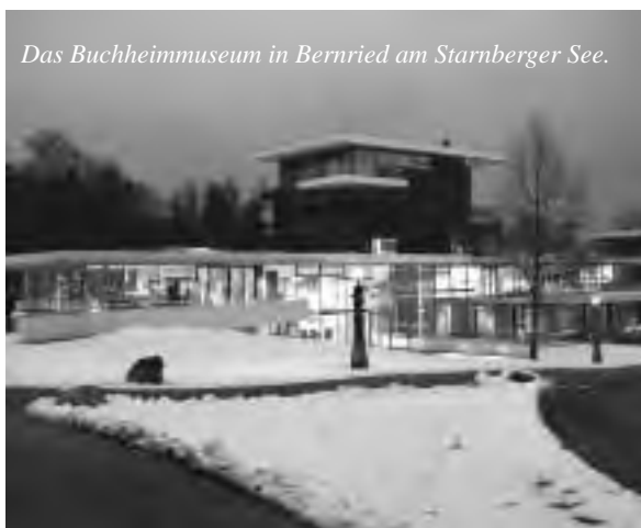
Das Buchheimmuseum in Bernried am Starnberger See.