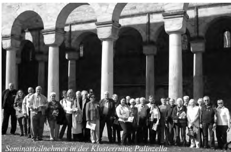
Seminarteilnehmer in der Klostersruine Palinzella

29 Männer und Frauen aus dem Rheinland, Emsland, Schwarzwald, Tauberland, aus Westfalen und Franken waren zum Seminar „Kirchen und Klöster in Thüringen ...“ angereist und im Bischöflichen Bildungshaus St. Ursula untergebracht. Das Programm ist in RENOVATIO 3/4 2008 nachzulesen. Die Einführung befasste sich mit der Gründung des Bistums Erfurt durch Bonifatius, der Darstellung von Mönchs- und Bettelorden, auch der Beginnen, alle mit großen Anlagen und Kirchen aus der Übergangszeit von Romanik zur Gotik vertreten. 30 Kirchen sollen es gewesen sein. Der erforderliche Reichtum resultiert aus Anbau, Handel und Verarbeitung von Waid. Aus seinen Blättern wird ein Indigofarbstoff gewonnen, der erst am „blauen Montag“ Farbe bekennt.